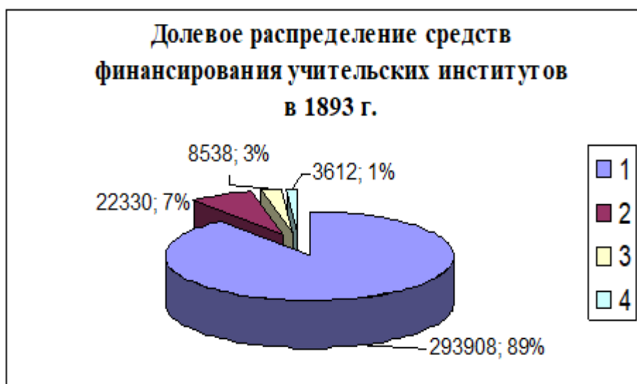
Рисунок 2. Средства финансирования: 1. из государственного казначейства – 293.908 руб. 82 коп. (89,5%); 2. специальных средств – 22.330 руб. 50 коп. (6,8%); 3. пожертвований – 8.538 руб. 13 коп. (2,6%); из свечного с евреев сбора – 3.612 руб. 28 коп. (1,1%).

Педагогические учебные заведения финансировались из нескольких источников. Диаграммы рисунков 2-4 представляют доленое финансирование учительских институтов, учительских семинарий и учительских школ в 1893 г. Учительские институты и семинарии получали в это время большую часть средств от казны, учительские школы наполовину содержались земствами и только чуть больше 1/3 (34,4%) части финансирования получали от казны. И данное преимущественное доленое участие государства в финансировании учительских институтов и семинарий сохранялось и в 1913 г. (институты 91,85% и семинарии - 77,96%).