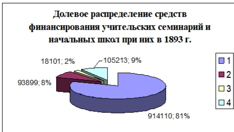
Рисунок 3. Средства финансирования: 1. из государственного казначейства – 914.110 руб. 34 коп. (80,8%); из сумм земств и городских обществ - 93.899 руб. 94 коп. (8,3%); 3. от сбора за обучение – 18.101 руб. 19 коп. (1,6%); 4. из сумм, поступивших из разных источников – 105.213 руб.19 коп. (9,3%).