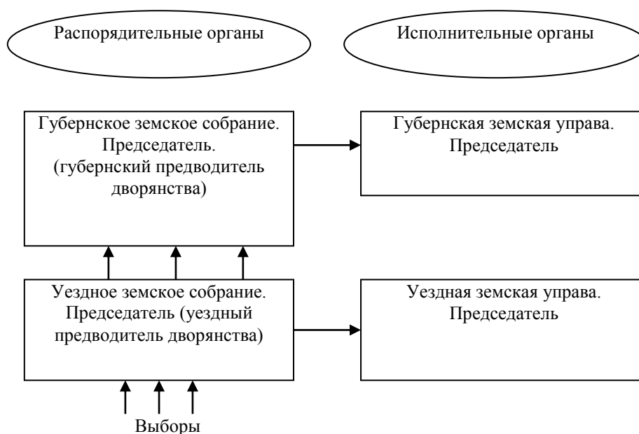
Рис. 3. Земские учреждения по положению о земствах от 1 января 1864 г. 28

Губернская земская управа состояла из председателя и шести членов, избираемых губернским собранием сроком на три года. Председатель губернской земской управы утверждался в своей должности министром внутренних дел. Другими словами, центральные власти имели возможность оказывать влияние на комплектование земских органов губернского масштаба (рис. 3).